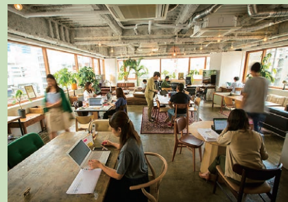
こだわりの家具や什器が配置された、開放感のあるオフィス。

当社は、各種ダイレクトマーケティングの支援サービスを展開してきた知見を活かし、自社ブランドのXサイズシャツ「リベレート」の通販も手がけています。ファン層が拡大し、売上も順調に伸びていますが、AmazonのFBA商品ラベルの印刷に悩まされていました。実はブラザーのTD-4420TNと出会って、ラベルプリンターでFBA商品ラベルが作成できることを知りませんでした。TD-4420TNのおかげで、タックシールのムダがなくなり、商品情報がすべて印字された美しいラベルが印刷できるようになり、商品への貼付ミスもなくなりました。ラベル印刷のコストも1円未満と安価ですが、それ以上に出荷作業を効率化できたメリットを実感しています。「リベレート」の今後の成長を支える、非常に優れたプリンターだと評価しています。