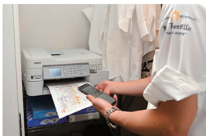
厨房内の狭い収納スペースでも設置可能。インク交換や給紙は本体正面からでき、スマホからの直接印刷も可能です。

MFC-J1605DNなら、プリンターとファクス電話が1台分のスペースに設置できます。同店では、メニューやワインリスト、スタッフシフト表、売上管理表など、毎月約1000枚の印刷物をすべてMFC-J1605DNから出力しています。また専用回線によるファクスは、食材の発注や仕入れ先からの見積り・請求書の受信などに使用。液晶画面で受信内容を確認できるため、インク代や用紙のムダもありません。