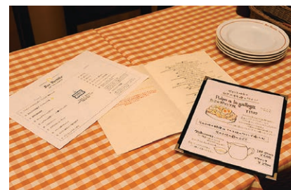
出力したメニュー類、グランドメニューやワインリスト(A4)、おすすめメニュー(B5)などを気軽に出力しています。

以前は出力センターで行っていたカラー印刷を、MFC-J1605DNで内製化。いつでも誰でも、気軽にカラー印刷が可能になりました。同店では用紙等の消耗品を各店舗から発注していますが、無償提供のネットワーク管理機能「BRAdmin(ビーアールアドミン)」を活用することで、本社からの各機器の設定や状況確認、インク残量の一元管理が可能。多店舗展開するチェーン店で好評です。