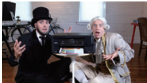
インクジェットプリンターの印刷コストにご関心のあるお客様向けデジタルコンテンツ (アメリカ販売会社Webサイト上の動画)

お客様に快適なデジタル体験を迅速に提供するため、グループ一丸となってデジタルマーケティング強化に取り組んでいきます。