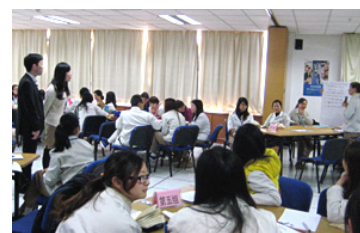
コンプライアンス集合研修風景

教育啓発活動としては、各種集合研修(新入社員研修、定期開催の基礎研修、海外赴任前研修など)や、e-ラーニングシステムによるオンライン研修を実施しています。また、従業員がより安心して相談できるようにするため、外部相談窓口を設置しています。さらに、コンプライアンス体制のグローバル展開として、中国、ベトナム、フィリピンなどの生産拠点でのコンプライアンス体制の整備状況や教育状況について再確認を行い、その結果に基づき教育啓発活動の強化を図るなど、グループとして適正なコンプライアンス体制の維持向上に努めています。他にも、近年の法規制の動向を踏まえ、各国の贈収賄防止法や独占禁止法等のコンプライアンス順守のために、法令の調査やグループ各社への教育啓発に努めています。今後も、「ブラザーグループ グローバル憲章」ならびに、「ブラザーグループ社会的責任に関する基本原則」を基礎として、グローバル視点でのコンプライアンス体制および教育を強化し、企業不祥事の未然防止や倫理意識のいっそうの向上に取り組みます。