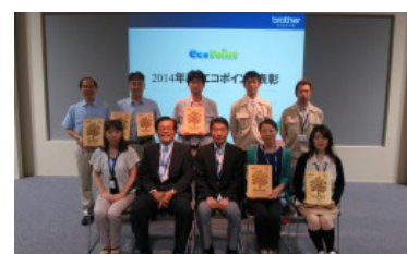
2014年度「ブラザーエコポイント活動」表彰 (2015年5月)

▶エコポイント活動に参加して森を作ろう http://www.brother.co.jp/product/support_info/recycle/ecopoint/index.htm