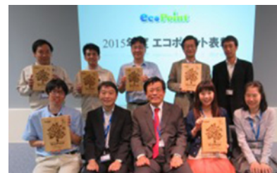
2015年度「ブラザーエコポイント活動」表彰 (2016年5月)

この他、ブラザー販売では、複合機やプリンターで利用された使用済みのトナーカートリッジやインクカートリッジの回収にポイントを付与する活動を推進しています。