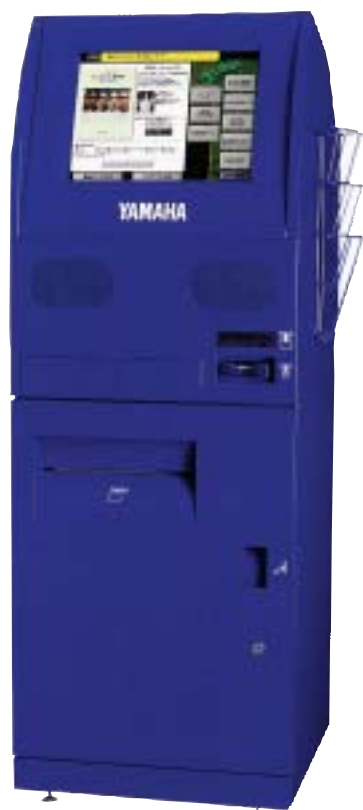
Muma II (ミュージマ)