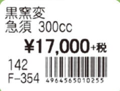
製品貼付用 / バーコード価格ラベル(小)