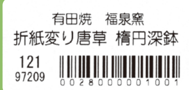
製品貼付用 / バーコード価格ラベル(大)