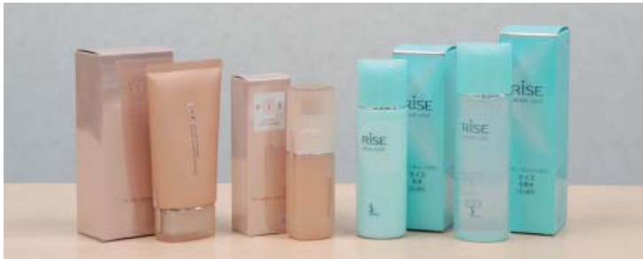
「エスト」(左)は百貨店専用的高級化粧品です。個別のお客様の肌に最良であることを目指した化粧品です。また「ソフィーナ」(右)は肌にとって本当によいものを求め、徹底した皮膚科学研究から誕生した化粧品です。

店頭システムを改良するにあたり、省スペースで接客業務の効率化を実現できるMPrintは欠かすことのできないプリンタでした。低コストで導入できたのもうれしい限りです。将来は、このプリンタの機能の一つであるBluetoothを使った無線接続を展望しています。店頭スペースをさらに効率的に活用し、お客様への接客サービスを強化するためです。その際、セキュリティ面などでも、ブラザーさんの一層の協力を期待しています。