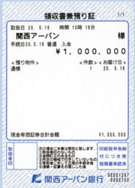
用紙(用紙サイズ/印刷領域):ブラザーCペーパーシリーズ C-12(高保存性感熱紙 74mm×105mm / 69mm×100mm)