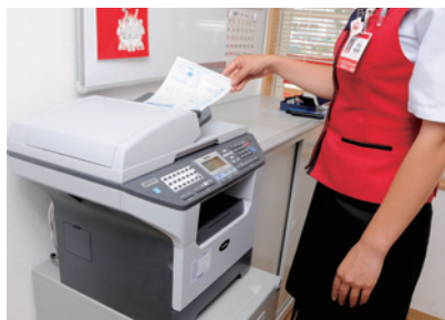
店舗のバックヤードに設置されたMFC-8870DW。多彩な機能がコンパクトサイズのなかに装備されている。

一般ファクス機能は、修理工場などの連絡に使われています。またネットワークプリンタとしてPCから各種資料を出力したり、コピーする際にもMFC-8870DWが活躍しています。高機能・コンパクト設計のMFC-8870DWは、同社の店舗業務を確実に支えています。