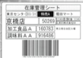
※掲載のラベルサンプル、使用シーンはイメージです