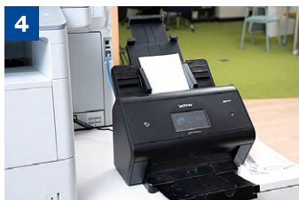
本社の共有スペースに設置されたADS-3600W