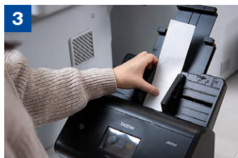
スマホ撮影できない長尺の領収書などもスキャン