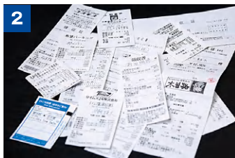
交通費、駐車場代、燃料代、飲食費などの領収書