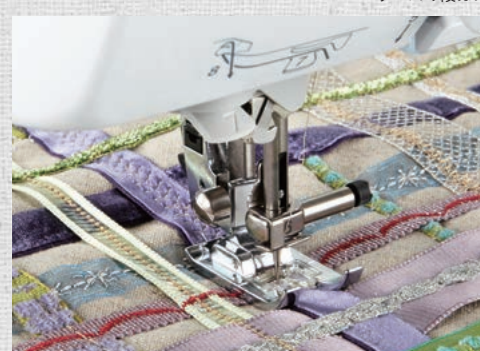
異素材の縫い合わせ