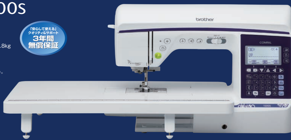
(ワイドテーブル装着時)

※製品改良のため、仕様の一部及び小売価格を予告なく変更することがありますのでご了承ください。 ※液晶画面は合成されたものです。 ※保証内容については保証規定に基づきます。