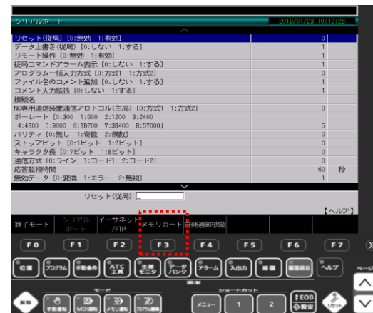
③ F3 (メモリカード) キーを押す