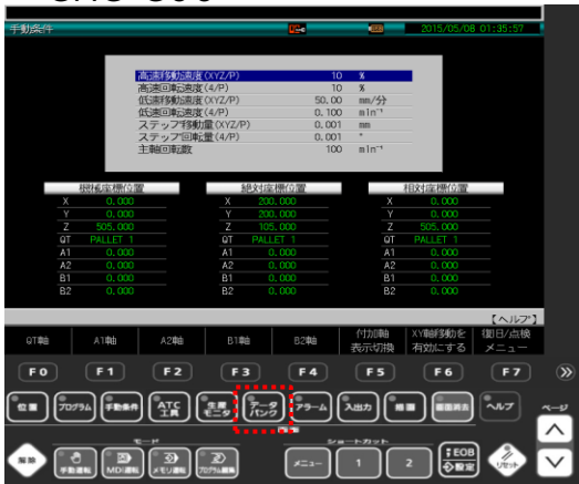
① データバンクキーを押す