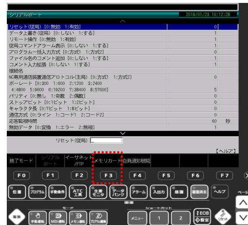
③ F3(メモリカード)キーを押す