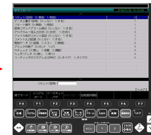
④ メモリカードの通信パラメータ画面