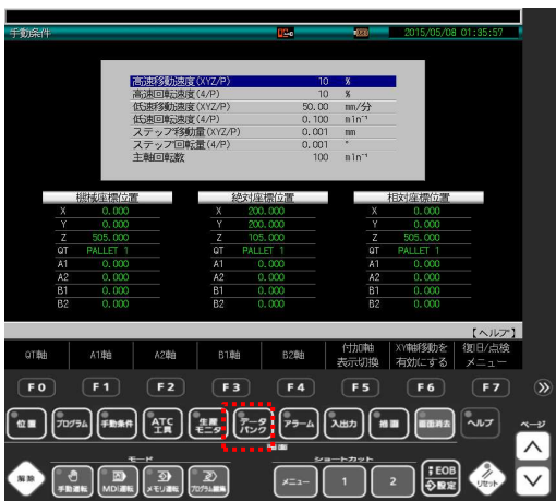
① データバンクキーを押す