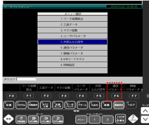
② F6 (通信パラメータ) キーを押す