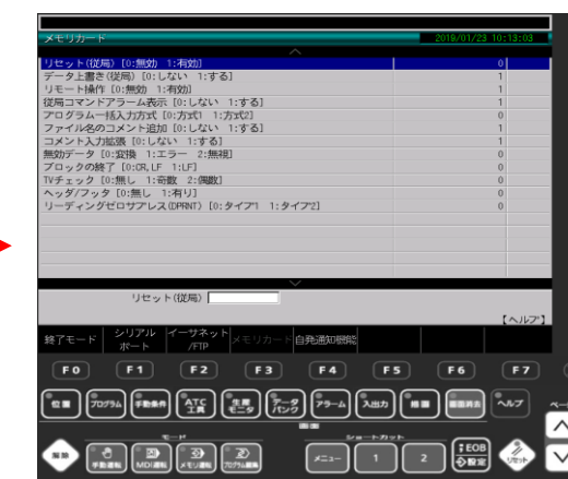
④ メモリカードの通信パラメータ画面