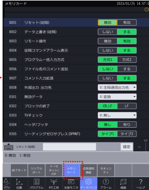
メモリカードを選択