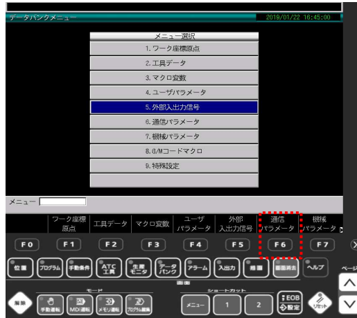
② F6(通信パラメータ)キーを押す